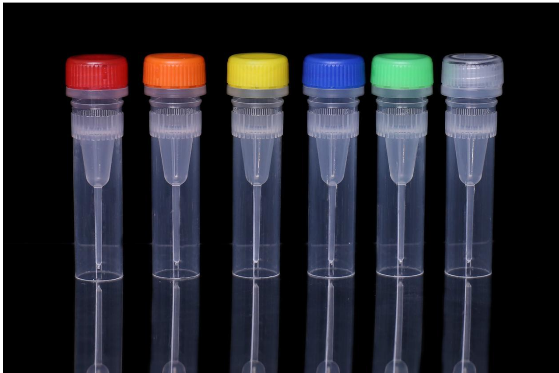
图一 0.5ML 保存管