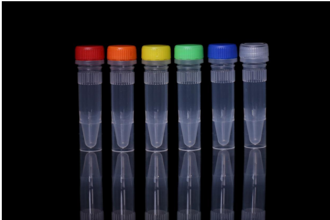
图二 1.5ML 保存管